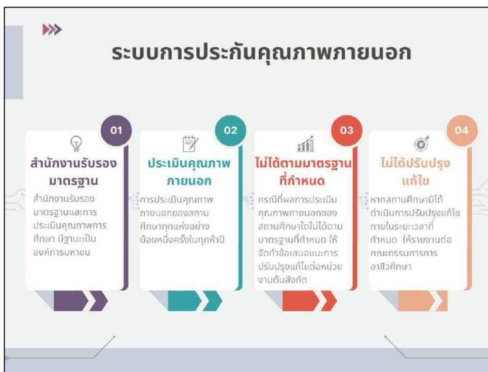
ภาพที่ ๒ แสดงระบบการประกันคุณภาพภายนอก

๖.๔ หากสถานศึกษามีได้ดำเนินการปรับปรุงแก้ไขภายในระยะเวลาที่กำหนดให้สำนักงานรับรองมาตรฐานและประเมินคุณภาพการศึกษารายงานต่อคณะกรรมการการอาชีวศึกษาเพื่อดำเนินการให้มีการปรับปรุงแก้ไขระบบการประกันคุณภาพภายนอก แสดงดังภาพที่ ๒