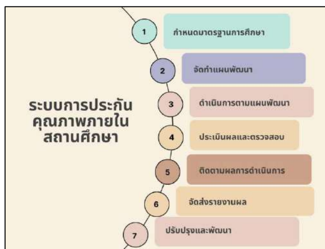
ภาพที่ ๑ แสดงระบบการประกันคุณภาพภายในสถานศึกษา

ระบบการประกันคุณภาพภายในสถานศึกษา แสดงดังภาพที่ ๑